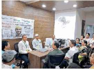
समय की मांग है श्रम सुधार • फाइल

जब पारंपरिक नौकरियों घट रही हैं, तब श्रम संहिताएं संतुलित विकास का ढांचा प्रदान करने में सक्षम होंगी