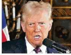
डोनाल्ड ट्रंप।

ट्रंप ने फक्स न्यूज पर लौरा इंग्रहम को दिए एक इंटरव्यू में यह बात कही। उनसे जब यह पूछा गया कि क्या एच-1बी वीजा का मुद्दा उनके प्रशासन के लिए बड़ी प्राथमिकता नहीं होगा। अगर कोई अमेरिकी कामगारों का वेतन बढ़ाना चाहता है तो देश में लाखों विदेशी