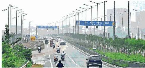
गंगा किनारे जैवै गंगा पथ पर टाई कुंआ। नवंबर में ठंड बढ़ने के साथ हवा भी प्रदूषित होने लगी है। ● जाबरा

जगन्नाथ संवर्धन, पटना : ठंड में बढ़ते होने के साथ ही प्रदेश की हवा भी प्रदूषित होने लगी है। बुधवार को पटना का औसत वायु गुणवत्ता सूचकांक (एयूआइ) मंगलवार की तुलना में कम रहा। मंगलवार को एयूआइ 196 था, जबकि बुधवार को 164 दर्ज किया गया। राजधानी में सबसे प्रदूषित हवा समनपुरा का 225 एयूआइ रहा, जबकि प्रदेश में सबसे प्रदूषित हाजीपुर रहा। वहां का एयूआइ 187 रिकॉर्ड किया गया। वहीं, प्रदेश में आठों हवा स्वच्छ रही, जहां का एयूआइ 49 दर्ज किया गया। राजधानी के समनपुरा में प्रदूषण बढ़ने का कारण निर्माण कार्य, सड़कों की ठीक से सफाई न होना है। इसके कारण सड़क किनारे घुस की मोटी परत जमा हो जाती है। मौसम विज्ञानी के अनुसार, गर्मी को तुलना में सर्दी के दिनों में वायु प्रदूषित होना आम बात है। सर्दी में तापमान कम होने के कारण हवा ठंडी हो जाती है। ठंडी हवा में हवा की तुलना में भारी होती है और नीचे की ओर आती है। इससे हवा की गति कम हो जाती है और प्रदूषित तत्व हवा में ही फंसे रह जाते हैं। सर्दियों में हवा में नमी कम होती है। नमी प्रदूषित कणों को आपस में चिपकाने में मदद करती है और उन्नी जमान पर गिरने में मदद करती है, लेकिन जब नमी कम होती है तो प्रदूषक अणु हवा में तैरते हैं। सर्द दिनों में धुंध और कोहर छाना आम है। ये प्रदूषक कणों को अपने अंदर समेट लेते हैं और हवा में घुस मिल जाते हैं।