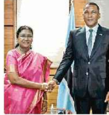
गवोरोने में बुधवार को बोत्सवाना के अपने समकक्ष इयूमा गिदोन बोको के साथ राष्ट्रपति द्रौपदी मुर्मु।

मुझे यह जानकर विशेष खुशी हो रही है कि बोत्सवाना 'प्रोजेक्ट चीता' के तहत चीतों को भारत भेजने जा रहा है। 'प्रोजेक्ट चीता' भारत सरकार की एक अनूठी वन्यजीव संरक्षण पहल है। द्रौपदी मुर्मु, राष्ट्रपति